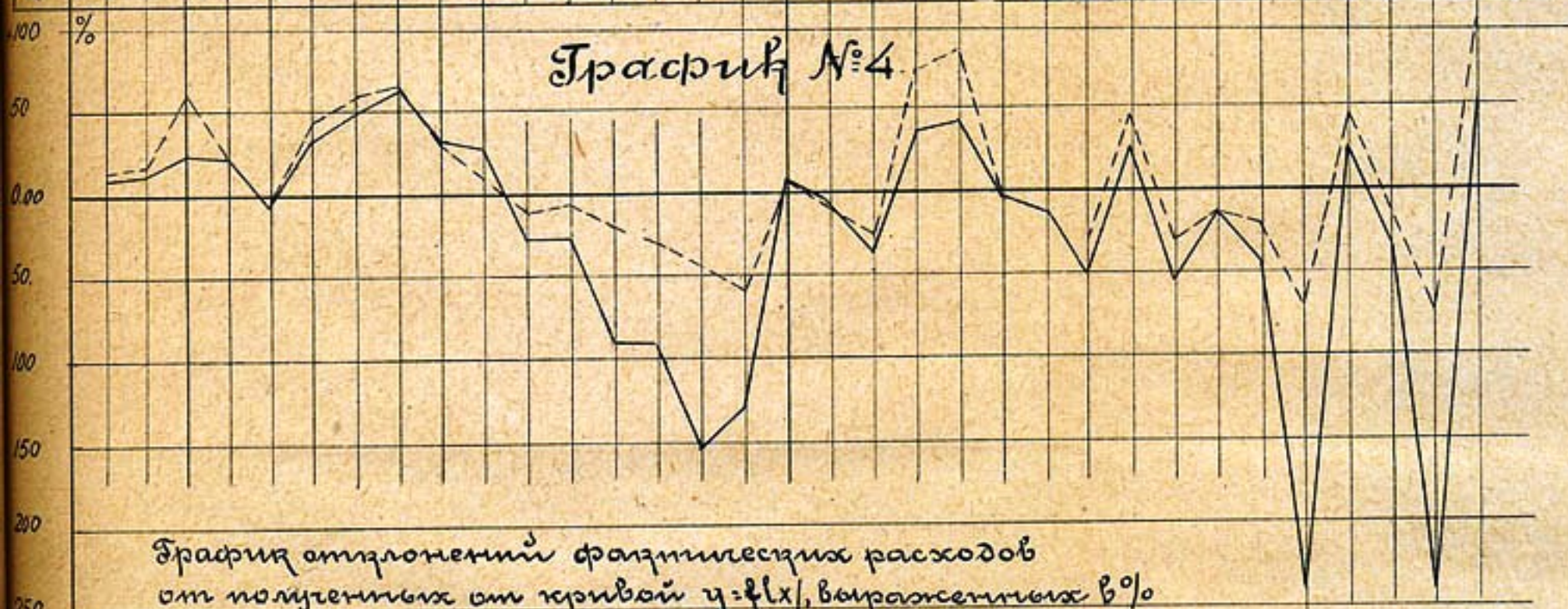
График отклонений фактических расходов от полученных от кривой y=f(x) , выраженных в % отклонений от фактических годовых и средней многолетней

Кривая отклонений в % от фактических расходов Кривая отклонений в % от многолетн. средней.