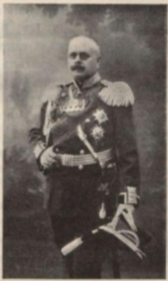
Генералъ-лейтенантъ Францъ Александровичъ Зейль. Председатель Финляндскаго Отдѣла Императорскаго Русскаго Военно-Историческаго Общества.